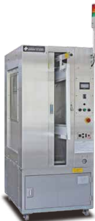
※写真はハイグレードモデルSC-BM500Hです。