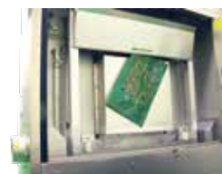
ミスプリント基板セット例 (アダプター使用)

枠レスマスク、基板洗浄用アダプターが標準装備。 メタルマスクの洗浄以外にミスプリント基板や、枠レスマスクの洗浄も可能。